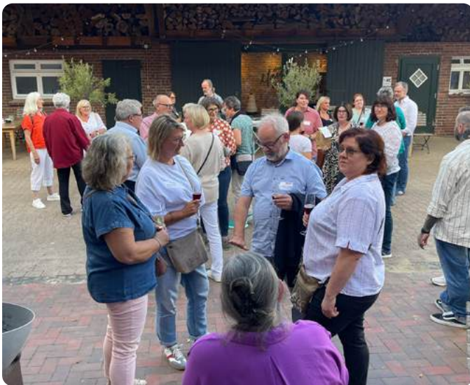
Intensives Wiedersehen beim Ankommen

Bitte den neuen Termin schon einmal vormerken: Freitag, 04.09.2026