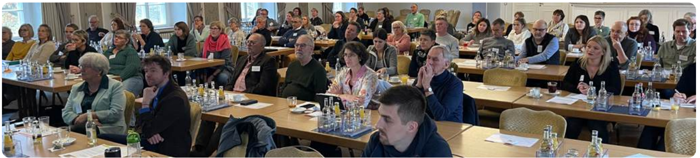
Impression aus dem Plenum