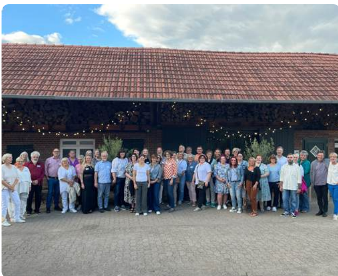
Die aktiven PAN. Netzwerkpartner