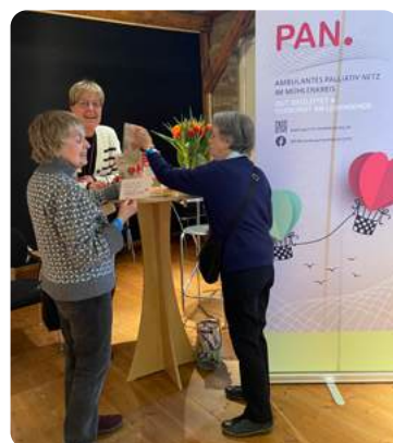
Gespräche am PAN. Infostand