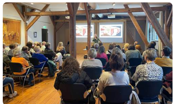
Vorträge zu verschiedenen Themen