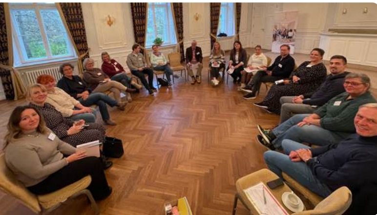
Austauschgruppen und Ergebnispräsentation am Nachmittag

Am Nachmittag arbeiteten die Teilnehmenden in moderierten Austauschgruppen an Themen für die zukünftige Netzwerkarbeit. Deutlich wurde dabei: Die Versorgung am Lebensende wird zunehmend auch zu einer gemeinschaftlichen Aufgabe – nicht nur für Fachkräfte, sondern ebenso für Familien, Freunde und Nachbarschaft. Die Ergebnisse der Austauschgruppen werden in der Steuerungsgruppe weiter bearbeitet und dann im Rahmen des Gesamtnetzwerk-Treffens am 15.04.2026 konkretisiert.