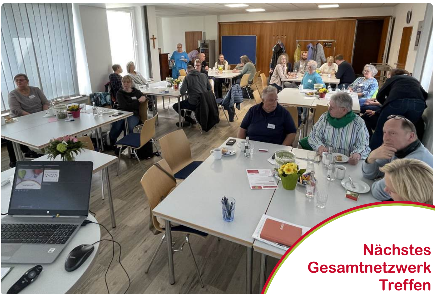
Intensive Gespräche in bunter Zusammensetzung

Nächstes Gesamtnetzwerk Treffen am 15.04.2026